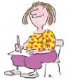
C'est décidé, je me syndique !

Pour se convaincre du contraire, essayez tout seul ! Le syndicalisme, ce n'est pas autre chose qu'une vieille idée, toujours d'actualité : ensemble, on est plus efficace qu'isolé.